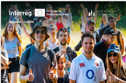
2. attēls: Reklāmas bildes piemērs