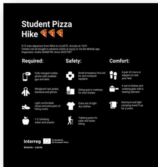
7. attēls. Vienkāršs līdzī nēnamo mantu saraksts

Sveiki! Lūdzu, izlasiet zemāk sniegto informāciju par pasākumu un nevilcinieties uzdot jautājumus. 📍 Tikšanās vieta: 28. septembrī plkst. 10:01 Lilastes dzelzceļa stacijā. 🚂 Vilciens no Rīgas Centrālās dzelzceļa stacijas atiet plkst. 9:13. Katrs dalībnieks ir atbildīgs par sabiedriskā transporta biļetes iegādi. Biļetes var iegādāties iepriekš tiešsaistē vietnē Vivi.lv vai izmantojot Mobilly lietotni.