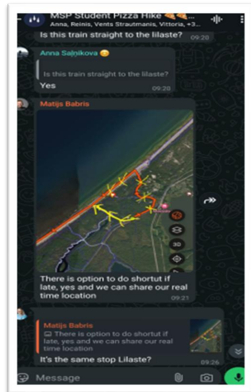
6. attēls. Dalībnieku WhatsApp čats