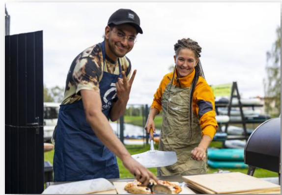
11. attēls. Picu sagatavošanas darbnīca

Kā bonuss pasākuma beigās bija picu sagatavošanas darbnīca (11., 12. attēls).